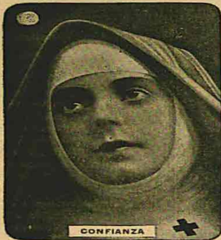
Toda Tableta Genuina Tiene el Monograma AK

En la seguridad y celeridad de su acción se le ha encontrado superior á cualquiera de sus antecesores en